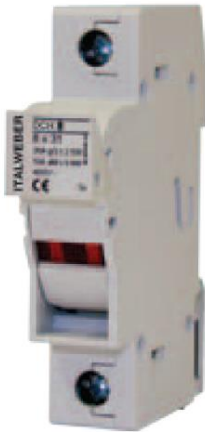
Foto del prodotto / Product image